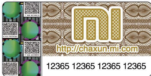
スクラッチオフ ラベル