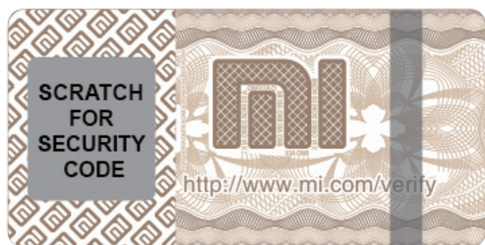
Наклейка для защиты от подделок

Каждый Внешний аккумулятор Mi Power Bank поставляется с наклейкой для защиты от подделок на наружной упаковке. Сотрите покрытие и перейдите на сайт http://chaxun.mi.com , чтобы проверить подлинность продукта.