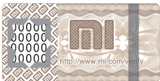
Стертая наклейка для защиты от подделок